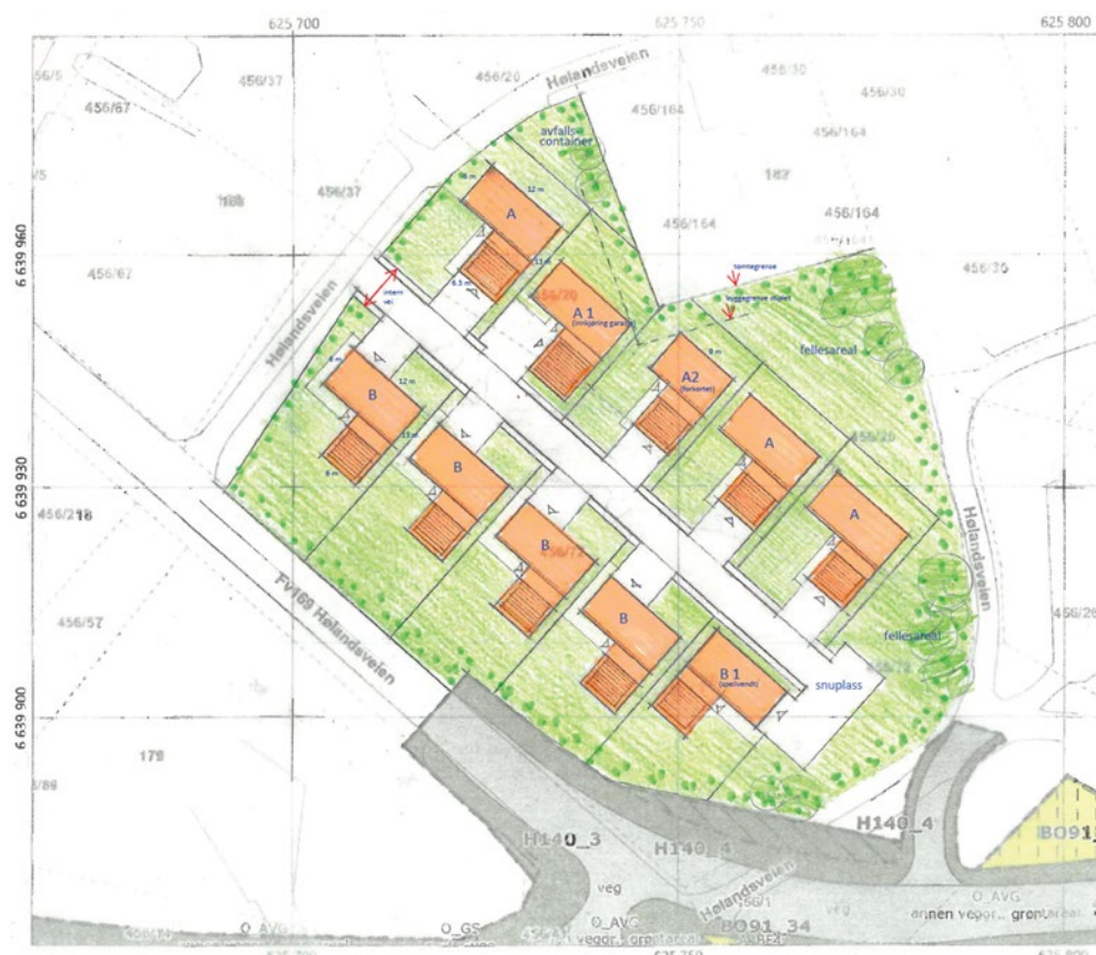
Figur 3: Situasjonsplan som diskutert i oppstartsmøte