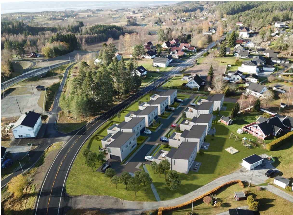
Figur 4: Perspektiv fra øst